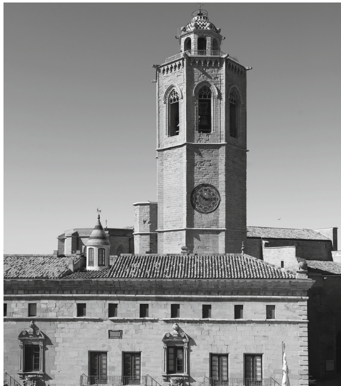
Façana de la Paeria de Cervera, lloc on se celebraven els consells de judicatura i on hi havia la presó.

En aquest context de violència i inseguretat, sembla que la bruixeria fou una de les preocupacions constants dels cerverins. Així ho fa creure el fet que, a Cervera, almenys sis dones fossin jutjades per bruixeria, encara que només hem pogut documentar una condemna a mort: la de la Magdalena.